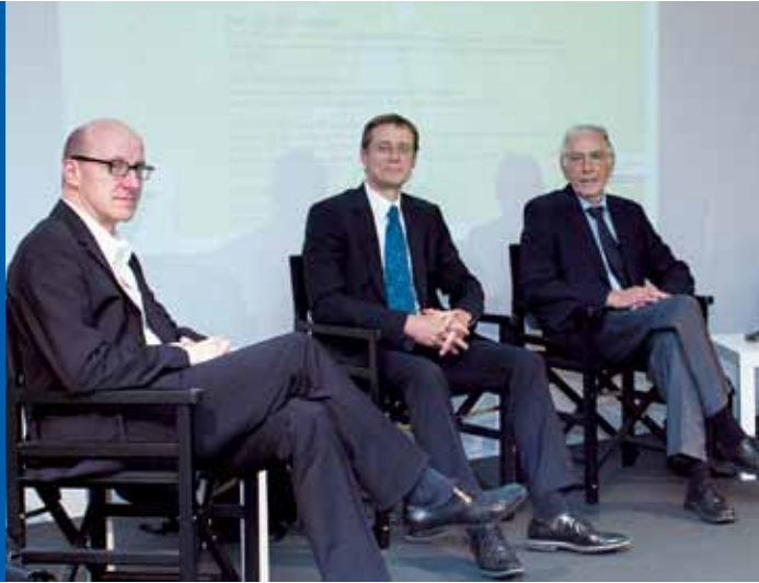
Wissenschaftler berichten aus ihrer Forschung: GiD-Diskussionsforum „Ein Leben auf Standby – Die modernen Volksleiden Stress, Burnout und Depression“ auf der MS Wissenschaft in Berlin-Mitte (September 2011).